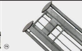
Endpfosten REP. D fit R+K