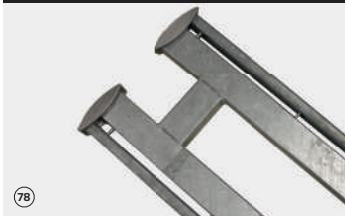
Mittelpfosten RP. D fit R+K